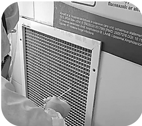
ب- نمونه برداری از سطوح

نتایج نمونه‌برداری از هوا و سطوح مختلف بخش ICU به ترتیب در جدول ۱ و ۲ ارائه شده است. مطابق جدول ۱، از ۱۰ نمونه جمع‌آوری‌شده از هوای اتاق، ۶ عدد آن مثبت (۶۰٪) بود که بیشترین غلظت RNA مشاهده‌شده مابین تخت شماره ۶ و ۷ بود (۳۹۱۳ کپی در میلی‌لیتر). همان‌طور که جدول ۱ نشان می‌دهد، بیشتر نمونه‌های منفی اعلام‌شده مربوط به هوای عمومی وسط بخش است که فاصله بیشتری از تخت‌های بیماران داشتند. میانگین