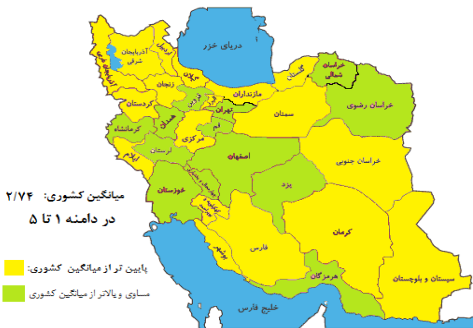
شکل ۱- توزیع سرمایه اجتماعی در استان‌های ایران نسبت به میانگین کشوری

که در نتایج مربوط به آن به مقدار سرمایه اجتماعی در بین کارکنان اشاره‌ای نشده است. مطابق نتایج تحقیق نام‌برده، سرمایه اجتماعی بر سرمایه فکری تأثیر معناداری دارد. پژوهشی که در سال ۲۰۱۸م بین کارگران ۵ کارخانه در شهر بابل گویای این بوده که میانگین امتیاز سرمایه