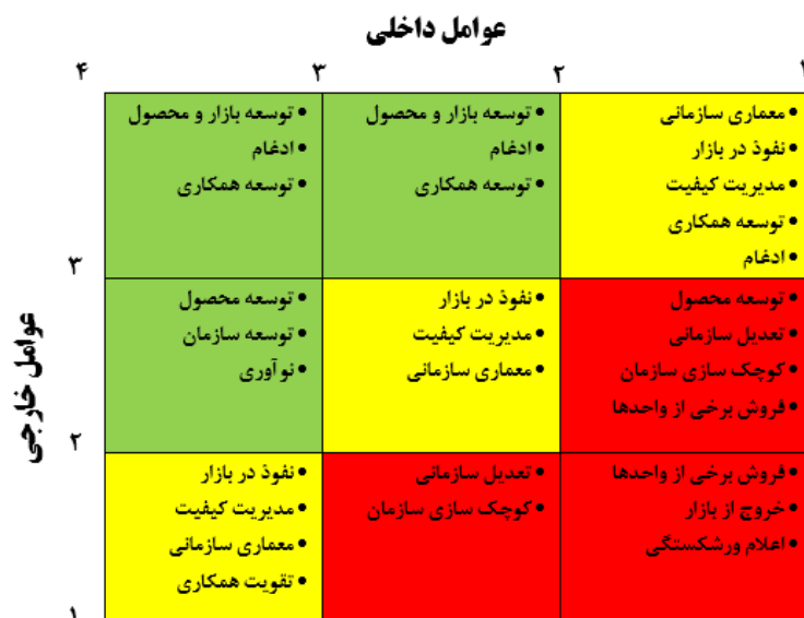
شکل ۳. ماتریس استراتژی‌های پیشنهادی توسعه رشته دانشگاهی ارگونومی