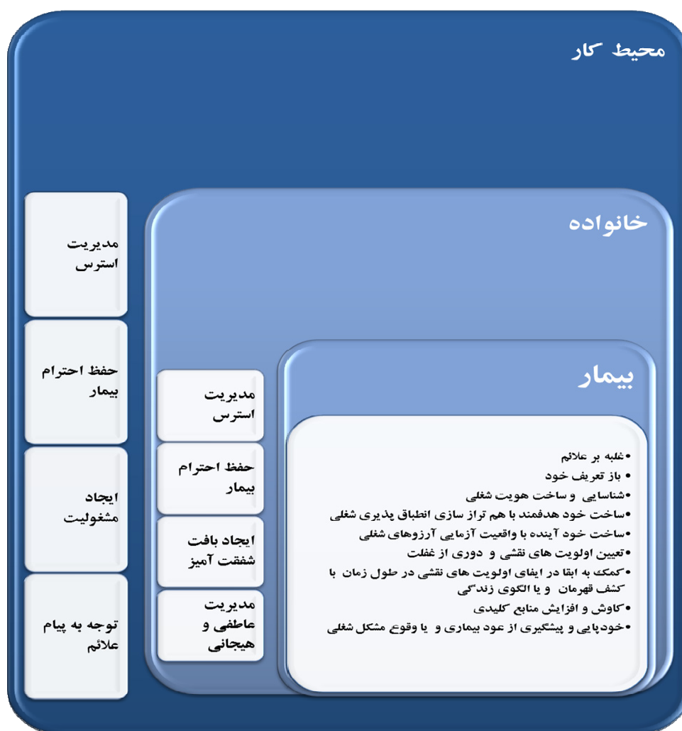
شکل ۲. برنامه توانبخشی شغلی افراد با اختلال دوقطبی

همانطور که در شکل ۱ نشان داده شده است، مدل مشکلات شغلی افراد با اختلال دوقطبی از متغیرهای زمینه ای تاثیر پذیرفته، عوامل محرک بر روی علائم اختلال دوقطبی تاثیر منفی گذاشته و در نهایت وجود عوامل تسریع کننده منجر به شتاب بخشی و ظهور مشکلات شغلی شده که در نهایت با جمع بندی مشکلات شغلی این افراد می توان به فقدان خردمندی شغلی افراد با اختلال دوقطبی رسید. با توجه به این مدل برنامه ای تحت عنوان برنامه ی