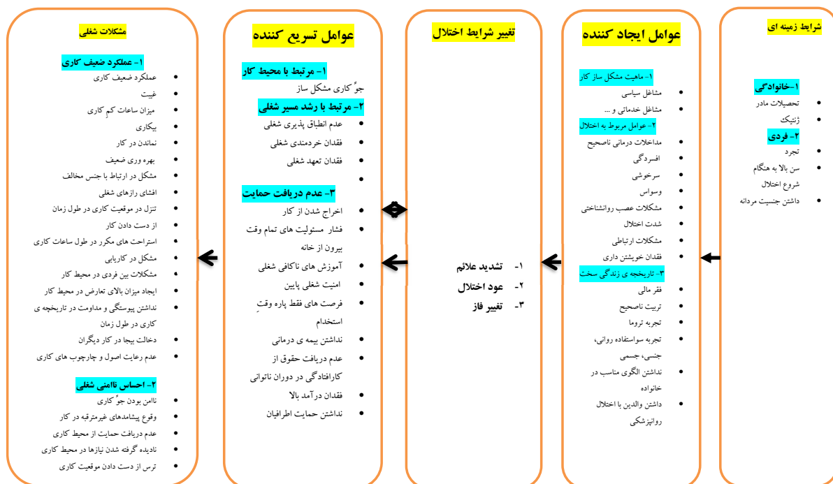
شکل ۱. مدل مشکلات شغلی افراد با اختلال دوقطبی

از تحلیل کیفی متن مصاحبه های افراد با اختلال دوقطبی درخصوص مشکلات شغلی شان با کدگذاری باز ۷۳ مفهوم فرموله شده استخراج شد که این مفاهیم به تناسب شباهت موضوع و مفهوم با کدگذاری محوری زیر مجموعه ی ۷ مقوله ی فرعی با عنوان (فقدان خویشتن داری، مشکلات ارتباطی، وسواس، افسردگی، سرخوشی، احساس ناامنی شغلی، ماهیت مشکل ساز کار و جوّ کاری