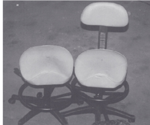
شکل ۱- صندلی زینی طراحی و ساخته شده

ناراحت - ۱۰ خیلی راحت) و اعداد بدست آمده در جدول ۳، صندلی طراحی شده از نظر استفاده توسط کاربران راحت ارزشیابی شد (میانگین ها بیش از ۷/۵ می باشند).