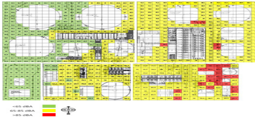
شکل ۱. نقشه صوتی واحد آب مجتمع پتروشیمی فجر