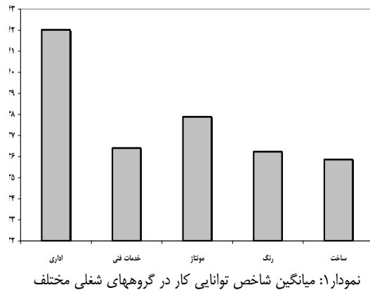
جدول ۴: مقایسه میانگین امتیاز شاخص توانایی کار در گروه‌های سنی مختلف