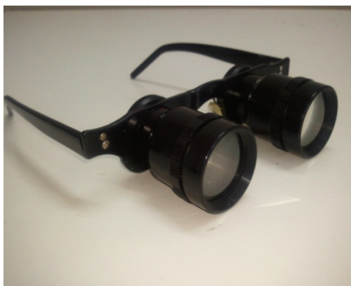
شکل ۱: لنز بزرگنمایی چشمی مورد استفاده در مطالعه.

شیفت کار ماکول نشد، زیرا افراد در ساعت آخر به ضبط و ربط ایستگاه کار خود پرداخته و دیگر به کار اصلی خود یعنی مونتاژ مدارهای الکترونیکی نمی‌پردازند.