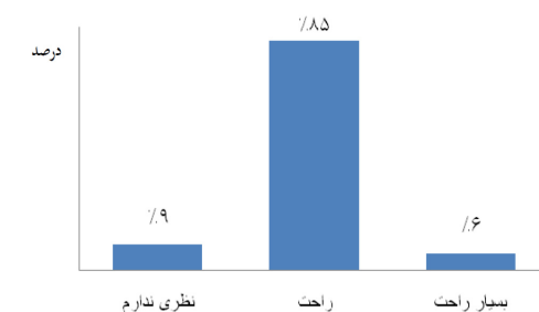
نمودار ۲- نظر مونتاژکاران در مورد راحتی استفاده از لنز بزرگنمایی در طول شیفت کار (n=۷۳).